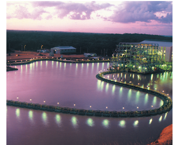
Km 25 da Rodovia PB 065 S/N Mataraca – PB CEP: 58.292-000 Brasil