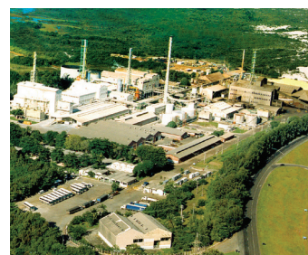
Rodovia BA 099, km 20, Abrantes Camaçari, BA. CEP 42.829-710 Brasil