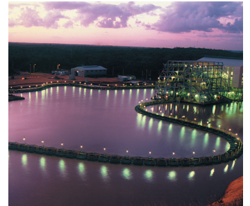
Km 25 da Rodovia PB 065 S/N Mataraca – PB CEP: 58.292-000 Brasil