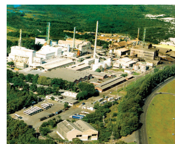
Rodovia BA 099, km 20, Abrantes Camaçari, BA. CEP 42840-000 Brasil