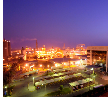
مجمع ينبع ترونوكس شركة الخليج للتيتانيوم المحدودة كيلو 21، ص.ب 30320 منطقة ينبع الصناعية 41912، المملكة العربية السعودية